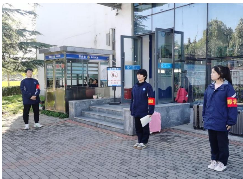
图 5-1 学校组织仪容仪表大检查