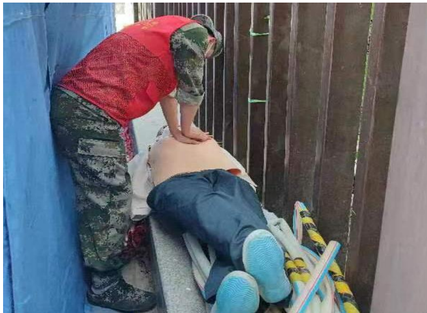
图 5-4：学校开展“生命安全”专题教育