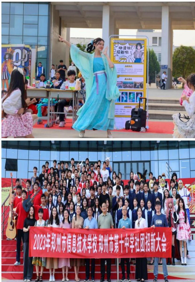
图 1-5：郑州市信息技术学校举行 2023 年社团招新活动