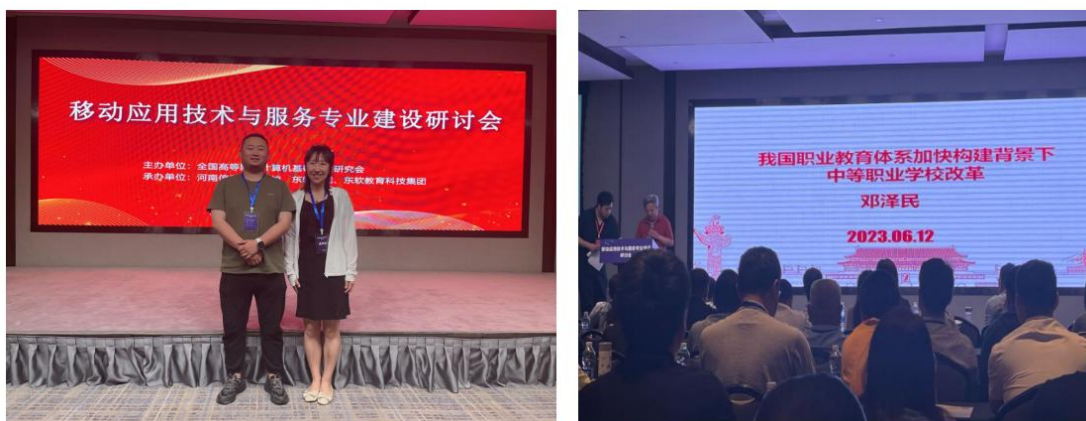
图 4-3：参加全国软件和信息技术服务行业产教融合共同体活动

6月，前往大连东软教育科技有限公司参观考察，学校计划于年底与大连东软信息技术有限公司从“专业建设、人才培养、1+X职业技能登记证书”等多方面开展合作。