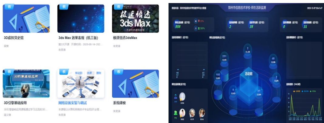
图 4-6: 学习通平台中数字化课程资源

一年来学校依托智慧校园平台、超星“学习通”平台，不断完善数字化教学资源库建设，通过将大量教案课件、教案视频、教案题库等教案资源放入教案资源库中，通过信息技术资源库使教师和学生充分利用免费资源，鼓励创建教师团队，积极打造《局域网技术实训》《三维设计与制作》《网页制作基础》等精品线上课程。学校目前借助智慧校园平台发布教学资源、进行课堂测验和课堂讨论，将全校学生、辅导员、任课教师、管理人员信息和专业、班级、课程、教室等，基础信息录入和导入系统。实现课堂点名、学生评教、学生成绩、课堂检查等功能。