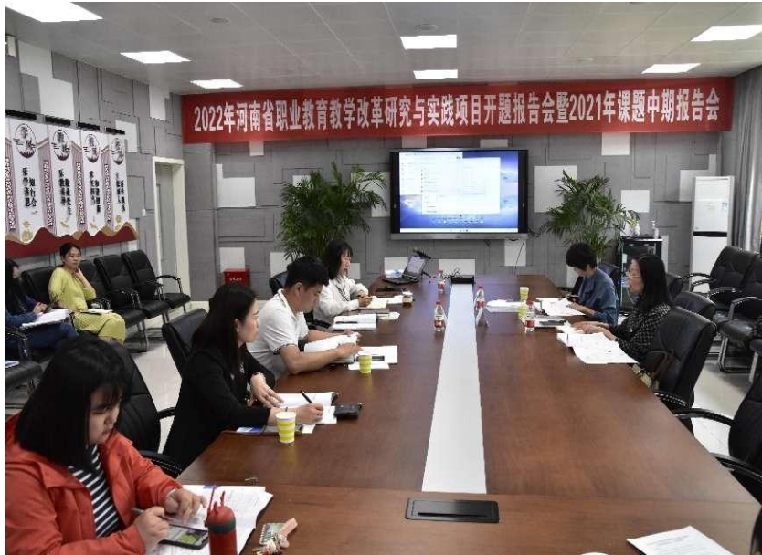
图 5-5 召开课题开题报告会助力学校科研工作开展