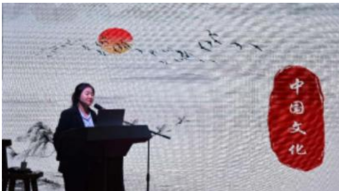
图 3-2：《鉴赏春晚经典文化》渗透中国文化