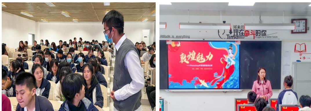
图 4-9：学校教师参加市优质课评比和汇报课展示活动