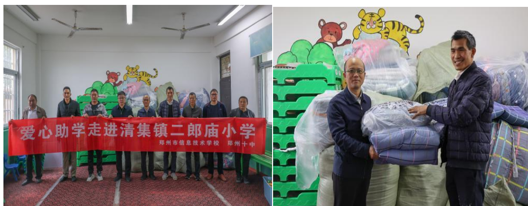
图 2-1 郑州市信息技术学校一行人为二郎庙小学献爱心

据悉，郑州市信息技术学校积极参与爱心公益活动，7.20水灾后，购买100件84消毒液，第一时间送到了荥阳市汜水镇十里堡村。疫情防控期间，党员志愿者的身影活跃在各自居住地的社区，为核酸检测等工作贡献了力量。