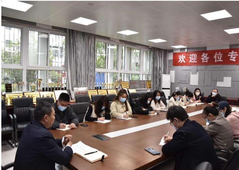
图 5-8 郑州市信息技术学校学习职业教育教学基本文件