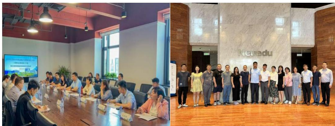
图 4-1：前往大连东软控股有限公司进行专业调研工作

依托郑州市网站建设与管理技能工作室、计算机应用技能工作室开展专业调研活动。学校教师参观了大连电子学校、大连东软控股有限公司河口软件园、大连东软信息学院软件园校区、东软教育科技园区，详细了解了东软教育在产教融合、创新创业、智慧教育、技术研究等方面的优势，未来希望与大连东软信息技术有限公司在搭建“专业建设、课程建设、完善学生评价体系、加强双师型教师培养、加强学生创新能力培养”等方面搭建市域平台，开展合作。