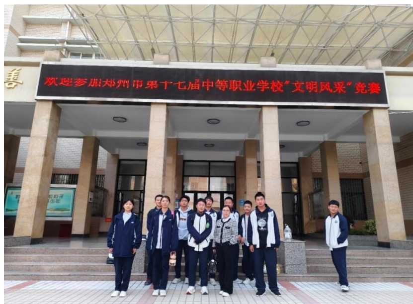
图 1-2：学生参加郑州市文明风采大赛

赛和“爱国故事演讲”比赛。课前五分钟，分小组汇报表演，各班都涌现出了非常好的题材和剧本，都取得了良好的效果，学生的各项素养都得到锻炼和提升。2023年10月17日，选出了“一个苹果的故事——抗美援朝记事”参加了郑州市思政课课本剧选拔赛，获得第六名的好成绩。