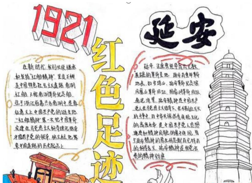
图 1-4：“寻找红色足迹”主题竞赛活动