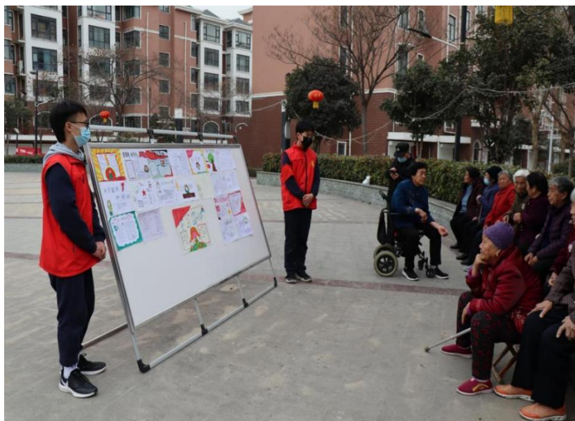
图 2-6 学生志愿者向居民群众讲解雷锋故事