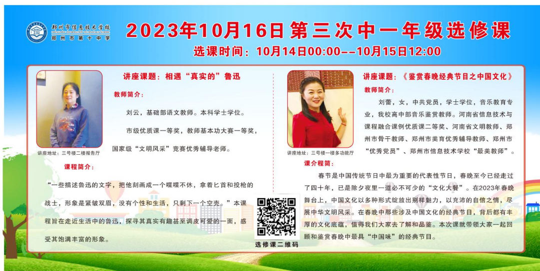
图 3-1：系列选修课渗透文化传承