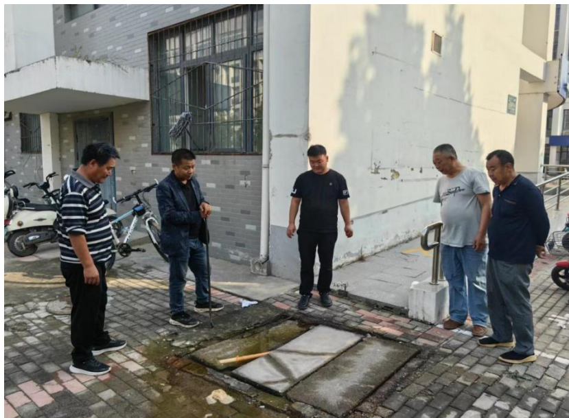
图 5-2：学校后勤保证工作

加强消防安全建设，全面对教学楼、宿舍楼消防设施进行维护维修，及时更新老化设备，维修线路故障、烟感器、消防水阀等更换；