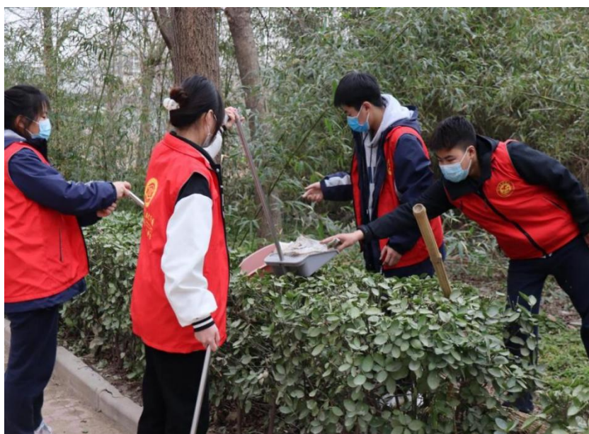
图 2-5 学生志愿者清扫社区草坪

活动现场，学生们将精心制作的手抄报展板摆放在小区街道两旁，并向社区居民详细讲述了有关雷锋同志的事迹和志愿者精神内涵，他们耐心、热情的讲解得到了周围群众的一致好评。未来学校将继续借着春风带领同学们发扬雷锋精神，让全社会感受到“雷锋精神、人人可学，奉献爱心、处处可为”。