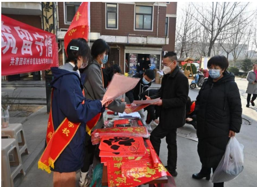
图 2-4 送春联志愿服务活动活动现场

参加本次活动的学生志愿者表示，这次活动送的不仅仅是春联，还是自己真挚的祝福。能够参与这样传播向上向善正能量的活动，真切地用自己的行动践行志愿精神，感到非常荣幸。