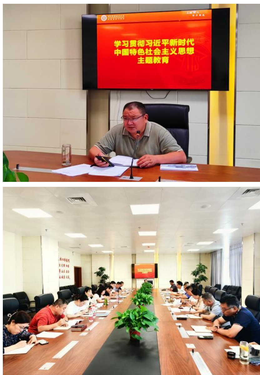
图 1-1：学校学习贯彻习近平新时代中国特色社会主义思想

等形式开展学习，组织校级以上领导干部、支部书记 3 人，开展为期 15 天的专题读书班，进行沉浸式学习，推动学思用切实贯通。分类推广“学习强国”“国家智慧教育公共服务平台”“青年大学习”等网络平台运用，组织专项培训，评选“学习达人”，确保入脑入心。实践基地研学，组织干部前往红色教育基地、廉政教育基地现场研学，集体“走出去”接受沉浸式实践教育。