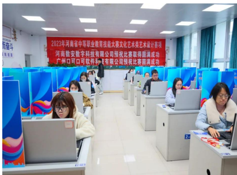
图 2-7 河南省中等职业教育技能大赛艺术设计赛项 在信息技术学校成功举办