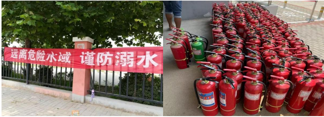
图 5-3：学校定期排查灭火器对存在问题进行及时更换