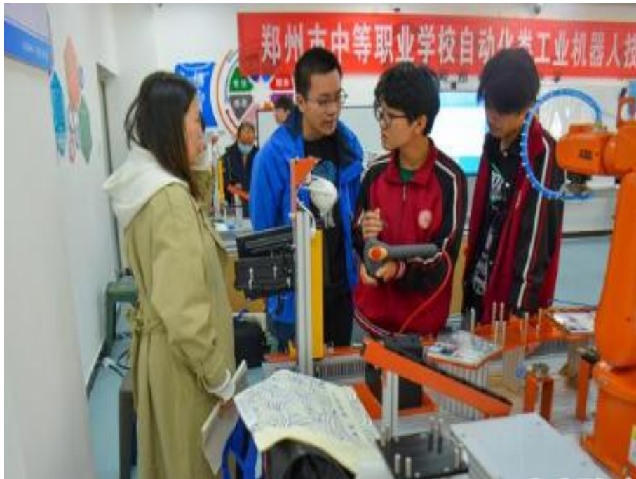
图 2-8 工业机器人技术应用赛项培训现场

公司密切对接，在培训场地布置、培训设备安装与调试、培训人员食宿安排等方面做了大量工作。学校一直重视技能大赛工作，希望通过此次培训达到技能加持、以练促赛的目的。